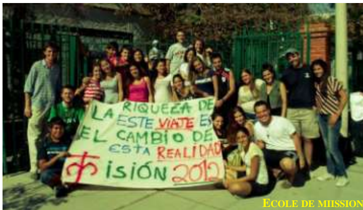
ECOLE DE MISSION

Par ailleurs, un groupe de 20 jeunes, essentiellement anciens élèves de nos collèges, réalisèrent leur première expérience missionnaire, également sur notre paroisse. Nous appelons cela une Ecole de mission . Ils ont vécu en communauté durant 10 jours, combinant les temps de formation et de spiritualité avec des activités missionnaires dans les quartiers. Ils consacrèrent une partie de leurs vacances à cette découverte de la mission, de la valeur de la vie et de l'engagement communautaires et de la foi partagée.