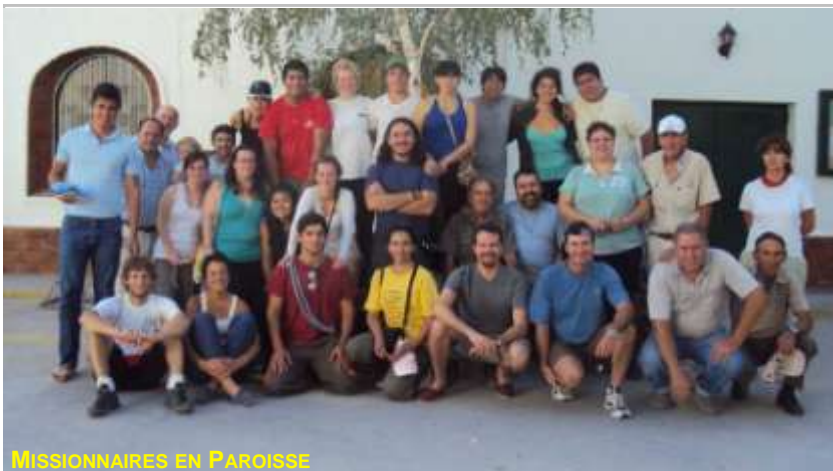
MISSIONNAIRES EN PAROISSE

En Argentine, l'Année Chaminade a culminé avec les nombreuses activités estivales de pastorale des jeunes et des vocations par lesquelles nous accompagnons la croissance de nos jeunes par la mission et le service