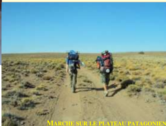
MARCHE SUR LE PLATEAU PATAGONIEN

Au cours du mois de janvier, une soixantaine de jeunes, membres des Groupes missionnaires marianistes, sont passés à divers endroits pour y réaliser un travail communautaire et y partager la bonne nouvelle de la foi. Leurs lieux d'action ont été dans la zone urbaine de la Province de Buenos Aires, mais surtout dans les secteurs ruraux de notre paroisse située en Patagonie qui s'étend en grande partie sur un plateau aride. Ils y ont vécu une expérience qui les a enrichis et transformés tout autant que leurs destinataires.