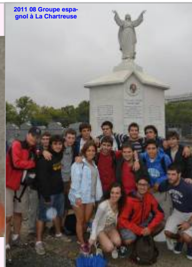
2011 08 Groupe espagnol à La Chartreuse

SOCIETE DE MARIE - SOCIETY OF MARY - COMPAN A DE MARIA