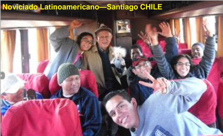
Noviciado Latinoamericano—Santiago CHILE