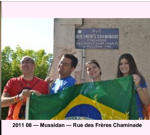
2011 08 — Mussidan — Rue des Frères Chaminade