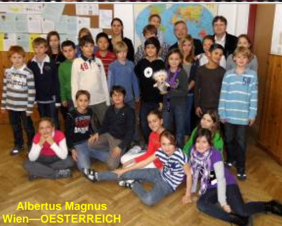
Albertus Magnus Wien—OESTERREICH