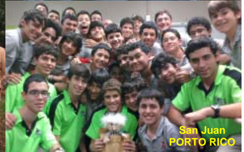
San Juan PORTO RICO