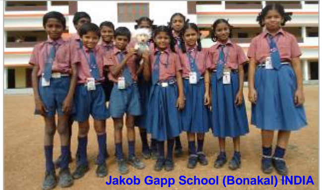
Jakob Gapp School (Bonakal) INDIA