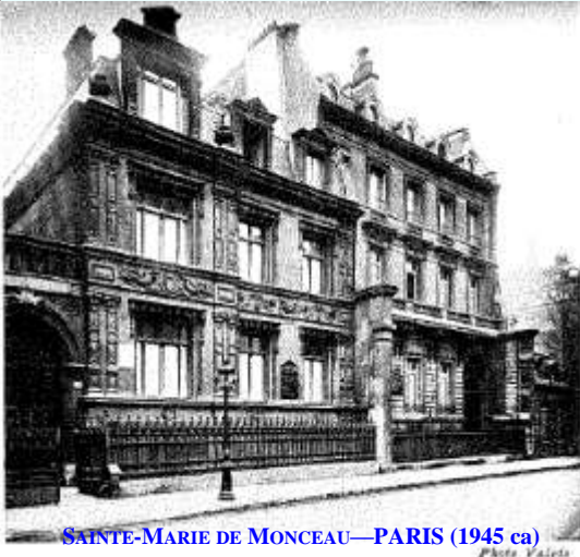
SAINTE-MARIE DE MONCEAU—PARIS (1945 ca)