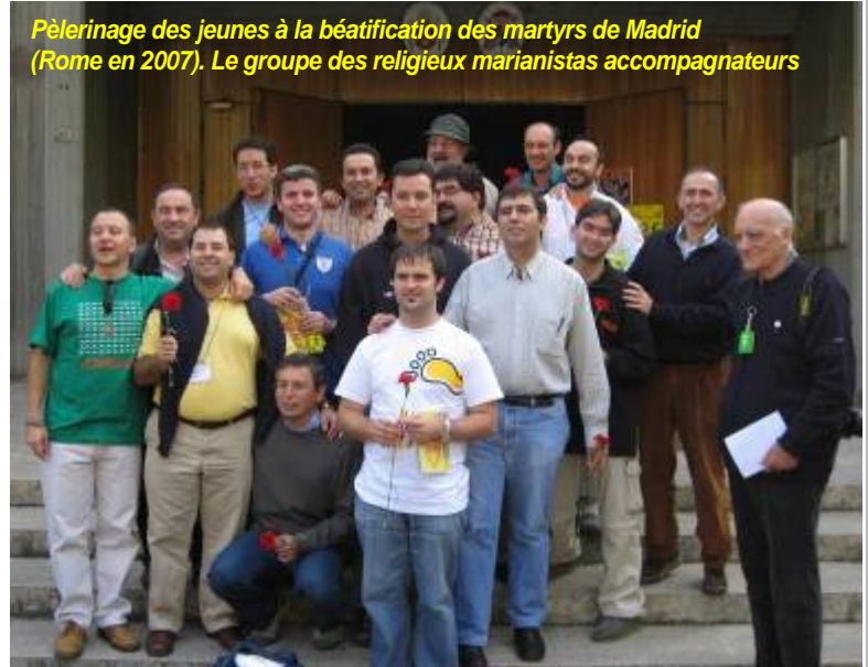
Pèlerinage des jeunes à la béatification des martyrs de Madrid (Rome en 2007). Le groupe des religieux marianistas accompagnateurs

Les agents de cette pastorale sont tous les frères de la Province, toutes les communautés et toutes les œuvres. C'est une responsabilité partagée, chacun s'efforçant de participer à l'objectif commun de la pastorale des vocations. Dans chaque communauté le supérieur est le responsable ultime de cette pastorale dans l'œuvre qui lui a été confiée. Nous avons aussi une Commission Interprovinciale des Vocations, avec la Province de Madrid, qui programme et évalue les activités vocationnelles et élabore des matériaux pour créer peu à peu une « culture vocationnelle », tant dans les communautés que dans les œuvres.