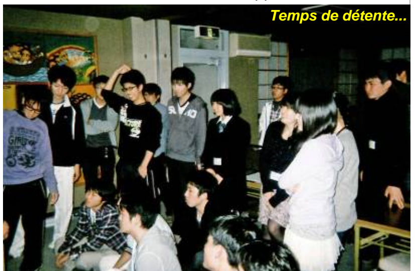
Temps de détente...

Au printemps de chaque année, durant la courte coupure entre la fin de l'année scolaire et la suivante, la Région du Japon organise une retraite et un temps de réflexion pour les élèves catholiques des établissements marianistes. Au Japon, ces dernières sont au nombre de cinq : Gyosei à Tokyo, Kaisei à Nagasaki, Meisei à Osaka, Kosei à Sapporo, et Koka, une école animée par les sœurs marianistes, également à Tokyo. Une invitation à participer à cette retraite est envoyée aux élèves catholiques de ces établissements et généralement trois ou quatre élèves de chacun d'entre eux y participent (Il faut noter que, en mai 2010, sur les 6739 élèves des établissements de la Société de Marie au Japon, 248 étaient catholiques). Ce programme se développe sur trois jours dans un lieu proche de Tokyo et a été proposé seize fois jusqu'à présent.