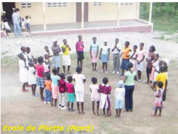
Ecole de Pilette (Nord)