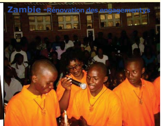
Zambie - Rénovation des engagements

SOCIETE DE MARIE - SOCIETY OF MARY - COMPAÑA DE MARIA