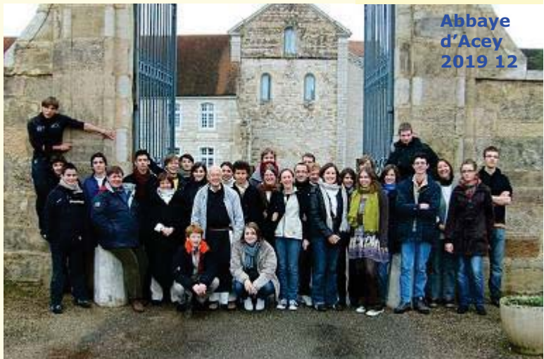
Abbaye d'Acey 2019 12