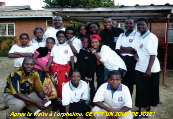
Après la visite à l'orphelina. CE FUT UN JOUR DE JOIE !

Notre groupe a souligné l'importance de partager le peu qu'il puisse avoir avec ceux qui n'ont rien. Nous nous arrangeons pour donner quelques biens de première nécessité et du matériel d'éducation.