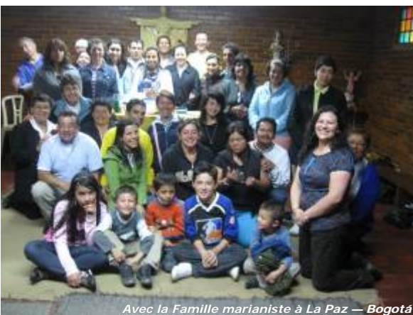
Avec la Famille marianiste à La Paz — Bogotá

Chaque communauté marianiste doit nommer un animateur de la pastorale des jeunes et des vocations. Ce sont eux qui accompagnent les jeunes intéressés par notre vie communautaire et notre charisme. Ils le font en chaque œuvre. Mon rôle est de soutenir continuellement ce travail et de conseiller et animer les frères chargé de cette tâche en chaque œuvre. Une autre tâche qui me revient est de rencontrer chaque