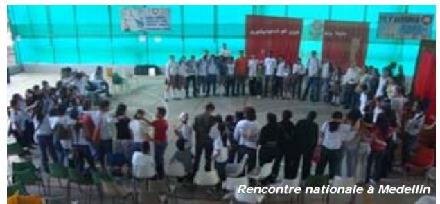
Rencontre nationale à Medellín

Cette année (octobre 2009) une rencontre culturelle se réalisera à la Ferme Santa María, près de Bogotá : le Premier camp de formation pour animateurs du MM . Au cours de ce camp nous travaillerons la proposition du MM avec les jeunes pour qu'ils s'"emparent" du MM et pour pouvoir ainsi, avec leur aide, consolider le mouvement.