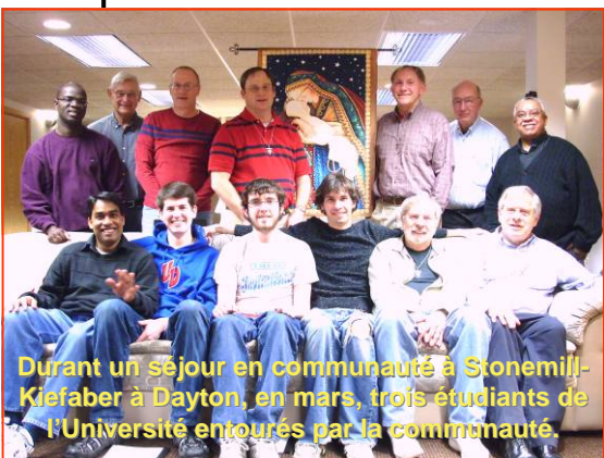
Durant un séjour en communauté à Stonemill-Kiefaber à Dayton, en mars, trois étudiants de l'Université entourés par la communauté.

Quel lien existe-t-il entre votre travail et la pastorale des jeunes de la Province ? Actuellement, nous recevons la majorité des demandes au travers de nos universités, du site internet provincial pour les vocations ( http://buildingcommunity.org/ ), du LA Congress (une rencontre annuelle de religieux éducateurs ayant lieu dans la région de Los Angeles) et des contacts personnels d'autre religieux ou d'anciens marianistes.