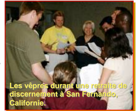
Les vèpres durant une retraite de discernement à San Fernando, Californie.

Il est important de bien communiquer et de tenir les frères informés de nos efforts vocationnels. Nous envoyons une lettre ( Vocation Newsletter ) à peu près toutes les six semaines et également un bulletin électronique hebdomadaire ( Vocation Notation ) adressé à tous les membres de la Province. Tous nous devons inviter d'autres à partager notre vie. Nous avons besoin de rappeler que la pastorale des vocations n'est pas seulement mon travail, celui de l'équipe provinciale, mais celui de tous les membres de la Province. Nous essayons de maintenir la pastorale des vocations comme une attention prioritaire pour tous. Quand je voyage à travers la Province et parle aux communautés, je dis aux frères que mon travail (pas ma personne !) est ce qu'il y a de plus important dans la Province parce qu'il concerne le futur. Nous avons besoin de nouveaux membres avec de nouvelles idées pour parvenir à partager notre charisme dans le futur. Je suis très confiant dans le futur, mais c'est une confiance réaliste. Notre futur nous appartient et est entre nos propres mains. Nous avons besoin d'inviter et de partager notre passion pour notre Fondateur avec les plus jeunes générations.