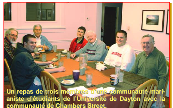
Un repas de trois membres d'une communauté marianiste d'étudiants de l'Université de Dayton avec la communauté de Chambers Street.