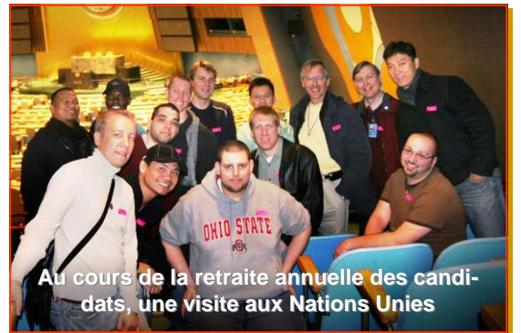
Au cours de la retraite annuelle des candidats, une visite aux Nations Unies

Nous avons, dans l'ensemble de la Province, quatre bureaux des vocations. Il y en a un dans chaque université (University of Dayton, St. Mary's University à San Antonio et Chaminade University à Honolulu); et le bureau national se trouve à St Louis. Je suis le seul consacré à plein temps aux vocations, mais j'ai une excellente équipe de 12 personnes qui travaillent à temps partiel dans ce ministère. Les membres de cette équipe assurent l'accompagnement des jeunes en recherche puis je travaille avec eux quand commence le parcours de « discernement » de chaque candidat.