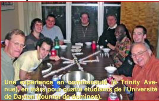
Une expérience en communauté (à Trinity Avenue), en mars pour quatre étudiants de l'Université de Dayton (fournot de dominos).

Quel message d'encouragement souhaiteriez-vous adresser à la SM à propos de la pastorale des vocations ? Je désire offrir à votre réflexion six convictions acquises au cours de ces sept dernières années.