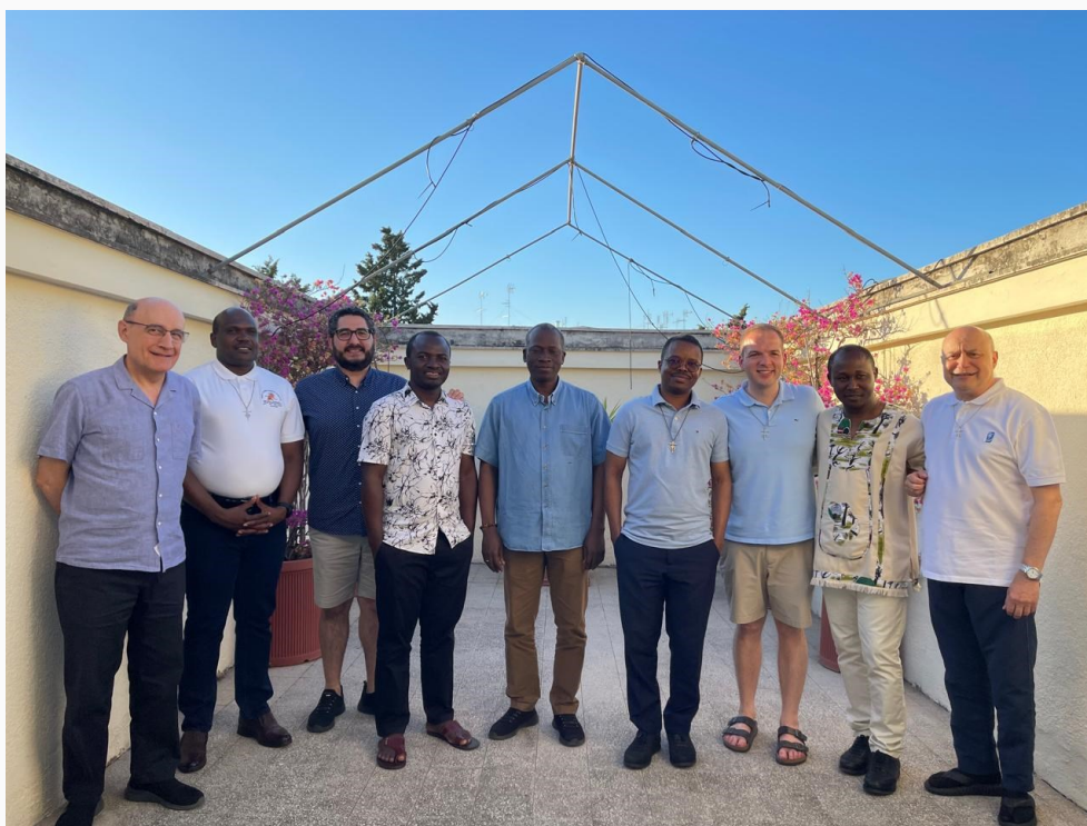
Les neuf frères qui quittent Via Latina 22