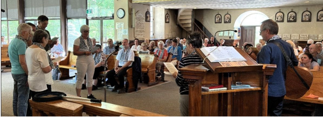
Renouvellement de la consécration à Marie par certains membres des CLM, lors du pèlerinage à Notre-Dame-du-Cap, à Cap-de-la-Madeleine (Trois-Rivières, Québec)

L'ajout de nouveaux membres aux CLM du Canada est un signe que l'Esprit continue d'élever de nouvelles vocations à la vie marianiste. Nous remercions ces nouveaux membres de la Famille marianiste et continuons de prier pour tous les membres de notre Famille au Canada.