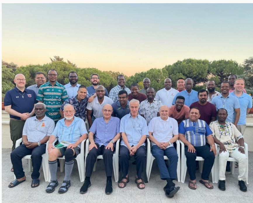
Les frères marianistes de Via Latina le 13 juin 2026.