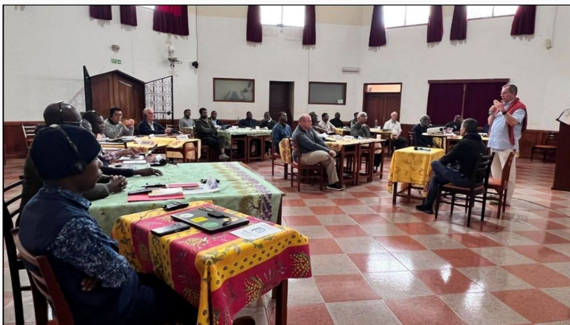
Session finale d'évaluation et de conclusion de la réunion Nazareth 2026.

Tout cela a des implications pour notre Guide de formation actuel, qui doit être révisé et mis à jour dans les années à venir.