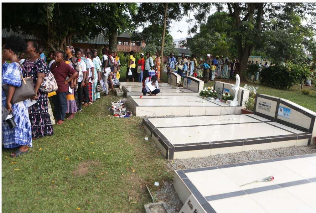
Peregrinos entorno de la tumba del padre Halter

Esta edición era especial porque conmemoraba el centenario del nacimiento del padre Halter (6 de diciembre de 1925). Muchos peregrinos acudieron a visitar su tumba y a pedir gracias a Dios por su intercesión. Participaron algo más de 3.000 peregrinos.