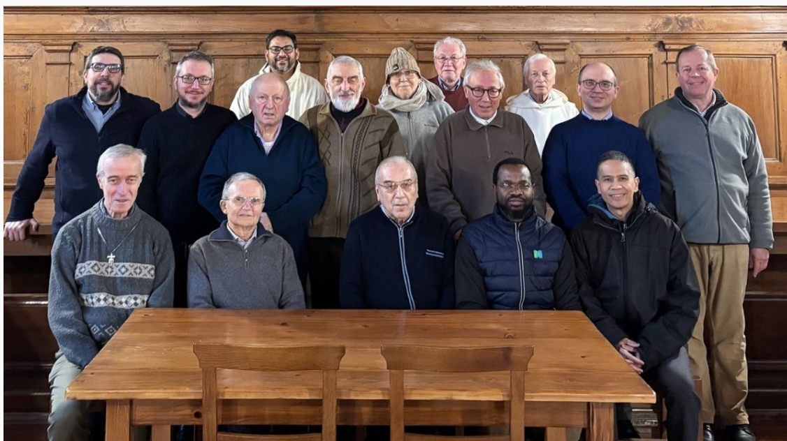
El Consejo General Marianista con la comunidad camaldulense

El Consejo General pasó en el Monasterio de Camáldula una semana, del 19 al 24 de enero de 2026, para su retiro anual. Se alojó en las habitaciones del monasterio y cada día se unieron a los monjes en la oración y en las comidas.