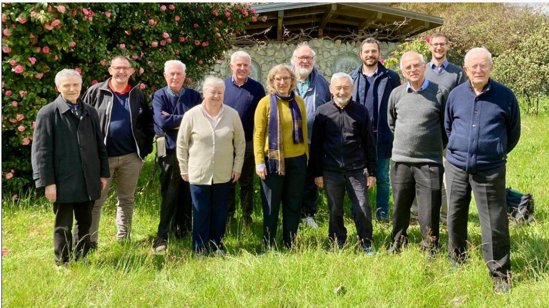
Participants dans le parc de la Villa Chaminade à Pallanza

La réunion annuelle de la Commission marianiste européenne pour l'éducation s'est tenue du 3 au 5 avril à la Villa Chaminade de Pallanza sur les rives du Lac Majeur. La communauté qui y réside a réservé un accueil chaleureux aux participants. Les représentants de l'éducation marianiste de France, d'Italie, d'Espagne et d'Autriche se sont réunis pour élaborer des projets communs pour les écoles marianistes d'Europe.